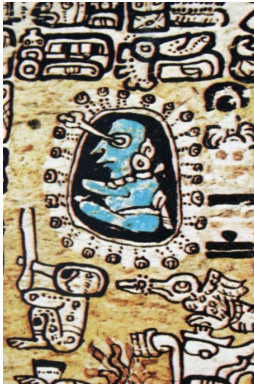
El observador del cielo atrapa con sus ojos las estrellas y planetas rodeado de constelaciones y glifos que relatan sus conocimientos astronómicos. Códice de Madrid.

fecha que equivale en nuestro calendario moderno al 21 de Diciembre de 2012.